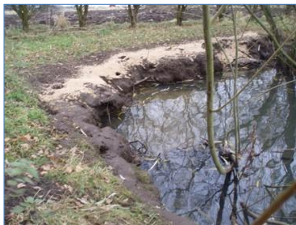
Billede: Fodring af vildt og rotter

Når kommunen informerer og vejleder borgere om rotter, sker det typisk ved den direkte kontakt mellem bekæmper og borger, men først når