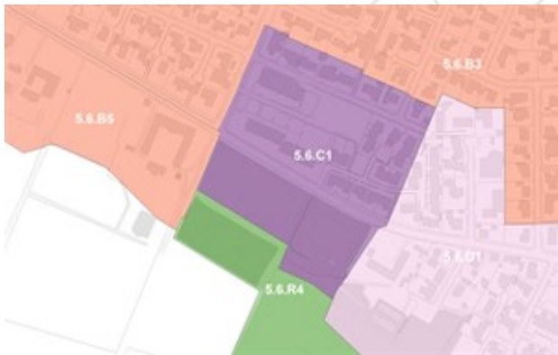
Afgrænsning af de gældende rammeområder

Nedenfor ses et før/efter kort, som viser, at der sker en lille udvidelse af rammeområde 5.6.C1 i den sydvestlige del af rammeområdet. Der sker ikke indholdsmæssige ændringer i rammerne.