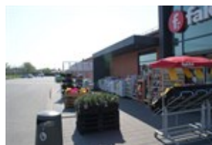
Eksisterende dagligvarebutik i området.

Området kan anvendes til både mindre butikker