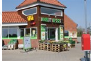
Kiwi lå i området nord for Mejlstedvej. Placeringen af indgangspartier er afgørende for, hvordan et område spiller sammen med omkringliggende byrum.

For at binde området bedre sammen skal der arbejdes med at forbedre og synliggøre stiforbindelser på tværs af Mejlstedvej i området.