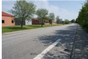
Mejlstedvej set fra vest.