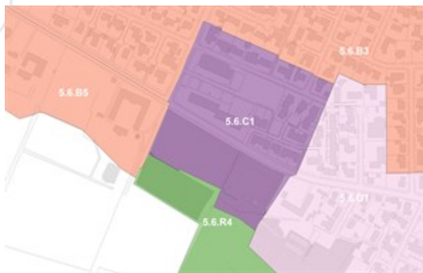
Afgrænsning af de nye rammeområder