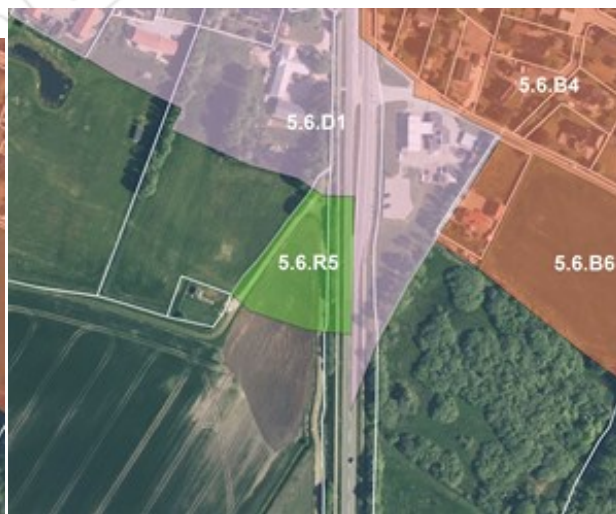
Afgrænsning af de nye rammeområder