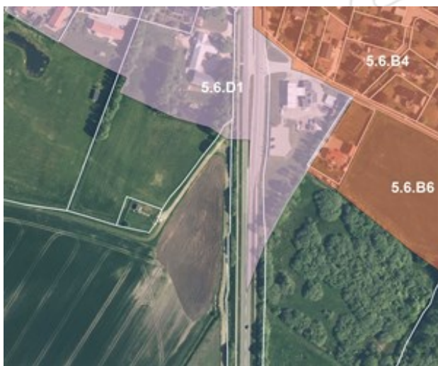
Afgrænsning af de gældende rammeområder

Tillægget vedrører et område til rekreative formål i den sydlige del af Vestbjerg. Rammeområdet udlægges på vestsiden af landevejen og får navnet "5.6.R5 Vest for Hjørring Landevej".