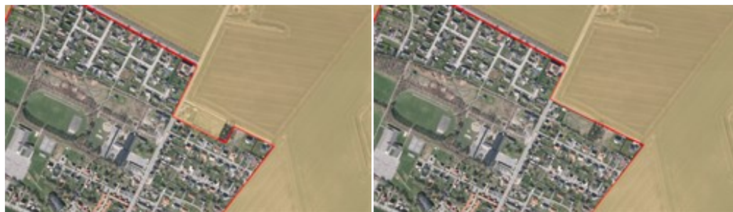
Gældende retningslinje for øvrige landområder