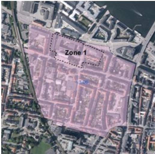
Luftfoto med zoneinddeling (se byggemuligheder i højre spalte)

Området anses som værende fuldt udbygget, med mulighed for byfortætning enkelte steder. Ny bebyggelse kan opføres som tilbygninger, udfyldnings- eller erstatningsbyggeri, hvor der er tale om stærkt nedslidte eller utilpassede bygninger uden særlig bevaringsværdi, eller hvor helheden vurderes at kunne styrkes ved til- om- eller nybygning.